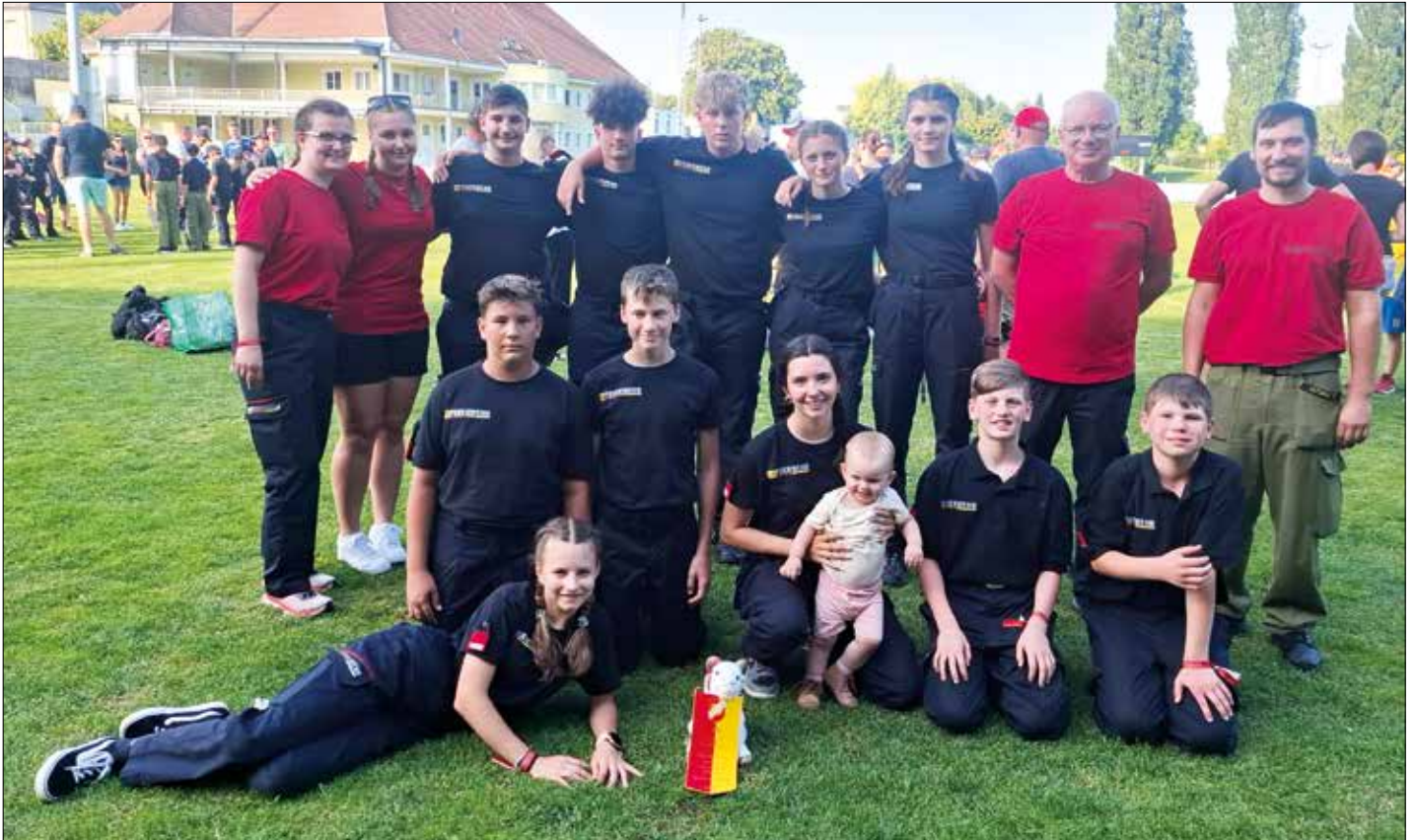
Die Mannschaft beim Landesfeuerwehrlustwettbewerb in Mattersburg