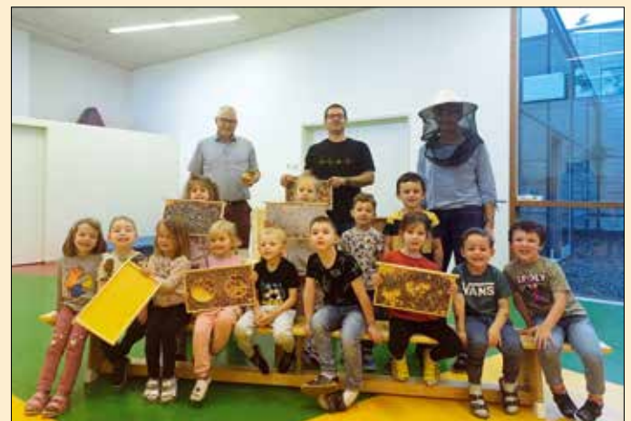
Sehr aufmerksam lauschten die Kinder den interessanten Erzählungen der Bienenexperten.