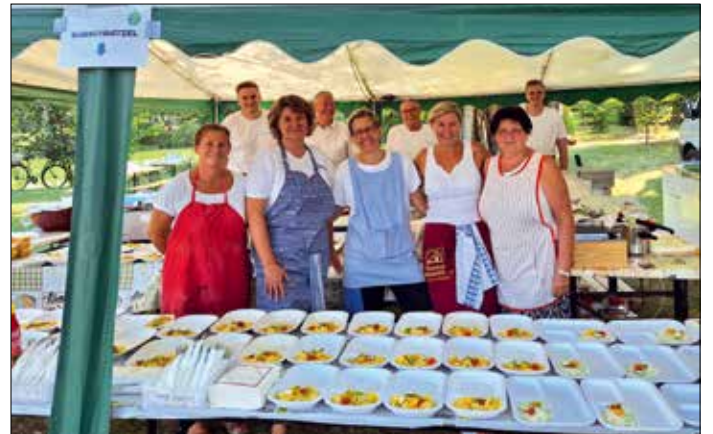
Die Küchencrew sorgte wieder bestens für das leibliche Wohl der Gäste.