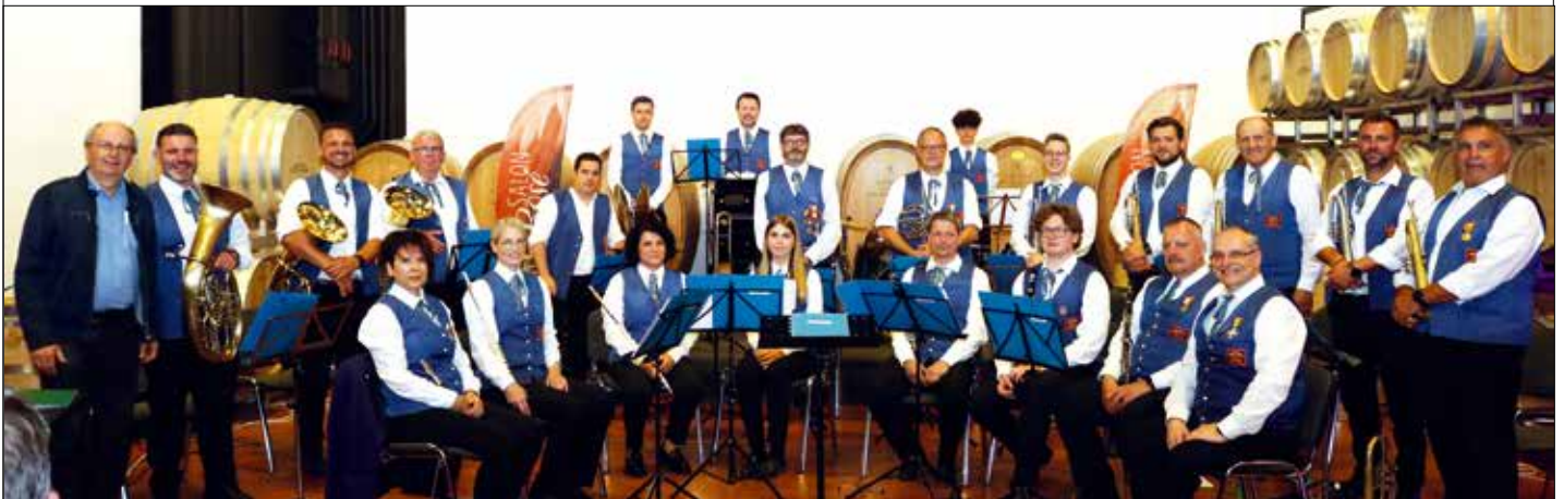
Am Vatertag lud der Musikverein zum Konzert in die Domaine in Pöttelsdorf ein.