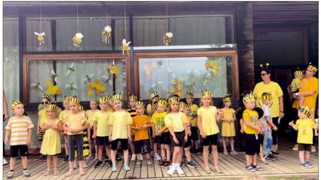
Am heurigen Kindergartenfest wimmelte es von Bienen!

Eltern, Großeltern, Geschwister, Freunde und Verwandte waren eingeladen, den Kindern bei ihren Darbietungen rund ums Thema BIENE zuzuschauen und zuzuhören. Für das anschließende gemütliche Beisammensein boten die fleißigen Eltern wieder Aufstrichbrote, Nudelsalate und Mehlspeisen zum Kauf an. Zum ersten Mal seit 2007 wurden wir von einem Gewitter überrascht. Nach dem Regenguss wurde bei guter Stimmung weitergefeiert.