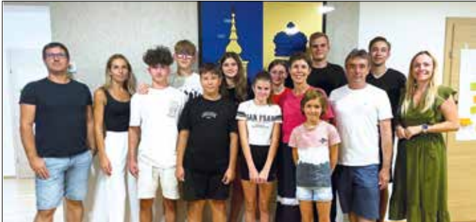
Die Jugendlichen der Gemeinde waren am 22. August 2024 wieder eingeladen, ihre Bedürfnisse in die Kommunalpolitik einzubringen.

Die Sommerferien wurden genutzt, um den 2. Jugendgemeinderat abzuhalten. Dabei wurden die Themengebiete Mobilität, Infrastruktur, Freizeit und Gemeindeleben gemeinsam bearbeitet. Durchaus interessante Ideen wurden von den jungen Gemeindegänger:innen dazu eingebracht. Abschließend lud die Gemeindeverwaltung zum Pizzaeessen ein.