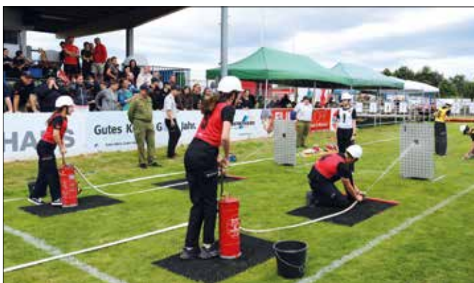
Mit Kampf- und Teamgeist zum Bezirkssieg!