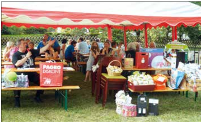
Über 60 Treffer konnten bei der Verlosung an glückliche Gewinner übergeben werden.