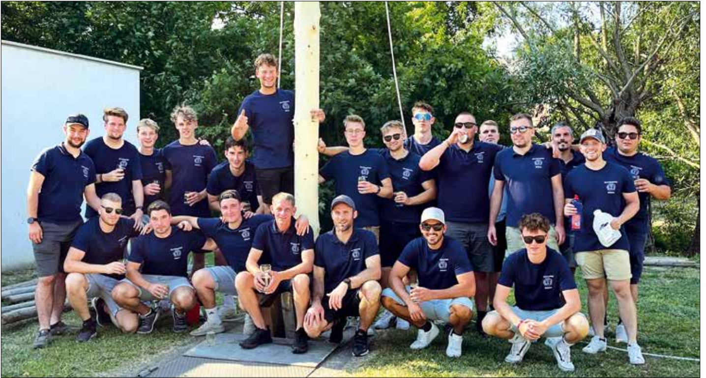
Strahlende Gesichter: Zum Auftakt des Burschenkirtages wurde traditionell der Kirtagsbaum aufgestellt.

Der neue Vorstand der Burschenschaft Stöttera hat die Feuertaufe bravourös bestanden! Mit Unterstützung von zahlreichen helfenden Händen und Spendern erwiesen sich die jungen Burschen als erfolgreiche Veranstalter. Sowohl am Samstag, als auch am Sonntag füllte sich der Veranstaltungsort am Sportplatz in Stöttera mit zufriedenen und gutgelaunten Gästen. Das