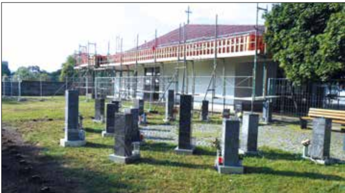
Die Dacherneuerung samt Installation der Photovoltaikanlage, der Einbau der neuen Fenster und neuen Kühlboxen sind bereits fertiggestellt. Aktuell werden die sanitären Anlagen erneuert und die Außenanlage hergestellt.