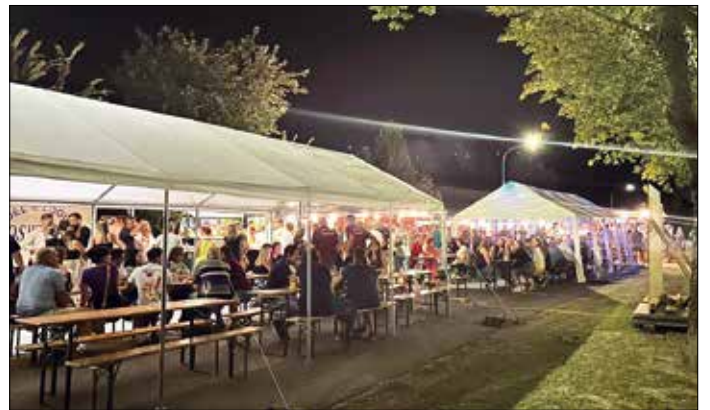
Beste Stimmung bei perfektem Sommerparty-Wetter und Blasmusik aus Leidenschaft der Blechdorfer Bömischen.