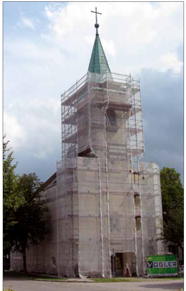
Die Segnung der Kirche ist am 25. Oktober 2020 geplant.