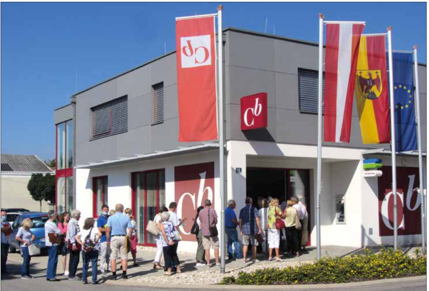
Vorwiegend ältere Kunden der ehemaligen Commerzialbank nutzten das Service-Angebot der Einlagensicherung in der Bankstelle in Zemendorf.